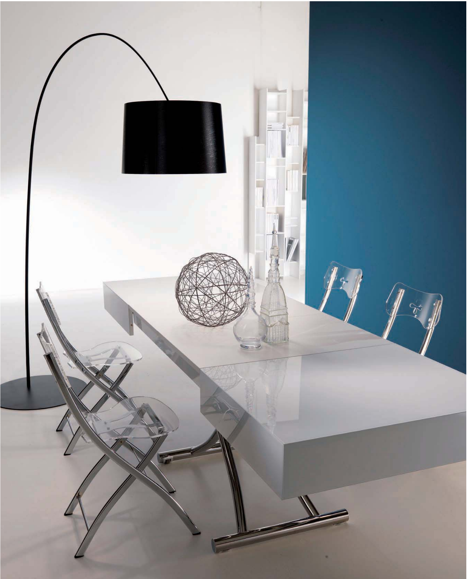
T110 tavolino trasformabile/ transformable table BOX S150 sedie/chairs OPLA